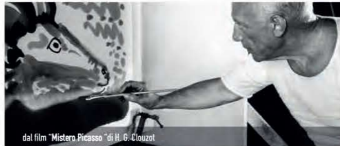
dal film "Mistero Picasso" di H. G. Clouzot

Età consigliata: 9/14 anni | Durata: 3h | Costo: 9 €