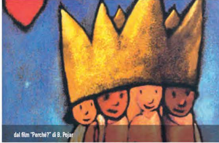
dal film "Perché?" di B. Pojar

Età consigliata: 8/14 anni | Durata: 1h40 | Costo: 6 €