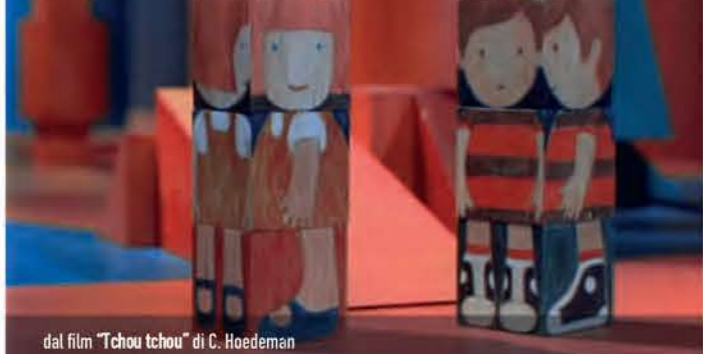
dal film "Chou tchou" di C. Hoedeman

Età consigliata: 8/12 anni | Durata: 2h | Costo: 9 €