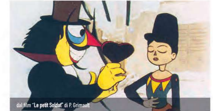
dal film "Le petit Soldat" di P. Grimault

Età consigliata: 5/10 anni | Durata: 2h30 | Costo: 8 €