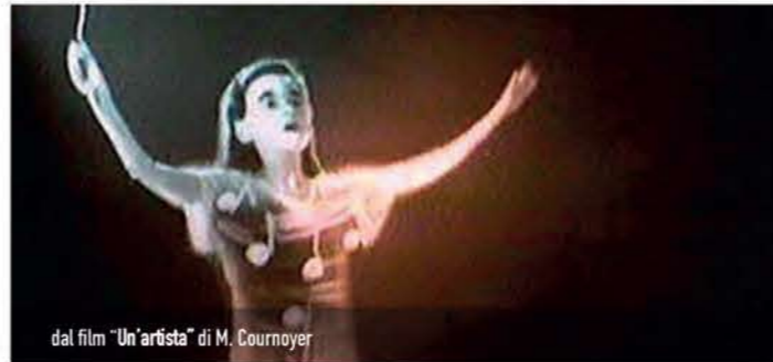
dal film "L'artista" di M. Courmoyer

Età consigliata: 9/14 anni | Durata: 2h 30 | Costo: 9 €