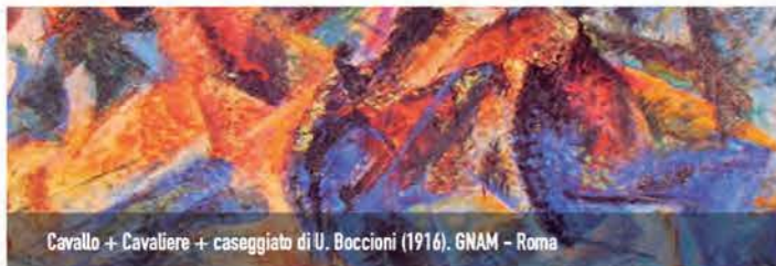
Cavallo + Cavaliere + caseggiato di U. Boccioni (1916). GNAM - Roma

Età consigliata: 8/14 anni | Durata: 2h/ 2h 30' | Costo: 10/13 €