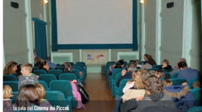
la sala del Cinema dei Piccoli

Età consigliata: 3/7 anni | Durata: 2 h | Costo: 9 €