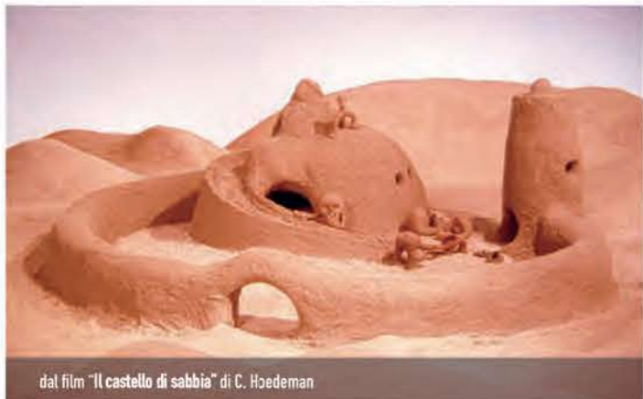
dal film "Il castello di sabbia" di C. Hoedeman

Età consigliata: 6/8 anni | Durata: 2h | Costo: 9 €