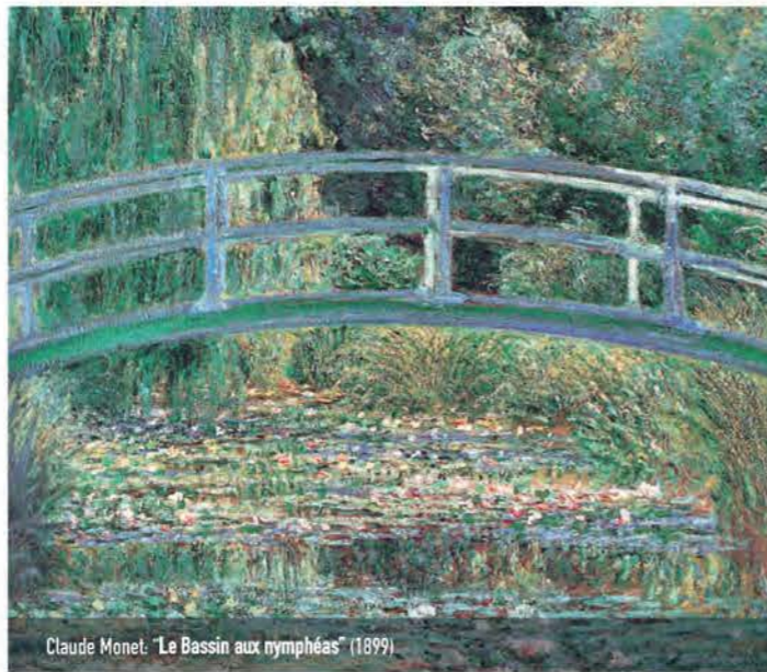
Claude Monet: "Le Bassin aux nymphéas" (1899)

Età consigliata: 6/10 anni | Durata: 2h 30' | Costo: 10 €