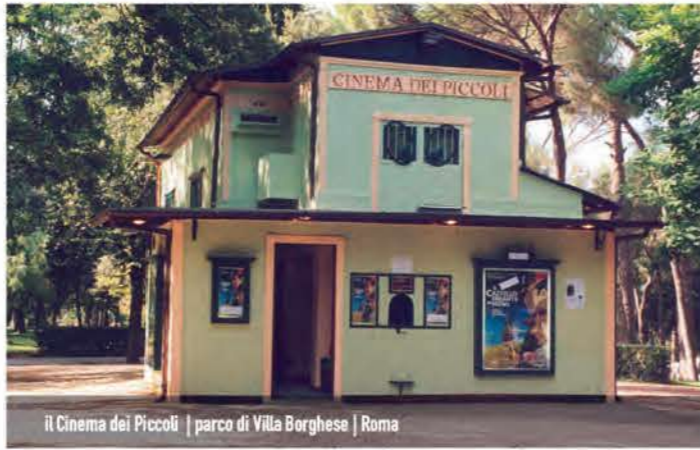
il Cinema dei Piccoli | parco di Villa Borghese | Roma

IL CINEMA DEI PICCOLI è dal 1934 il cinema dei bambini di Roma. Con le sue dimensioni a misura di bambino è il cinema più piccolo del mondo (Guinness World Record).