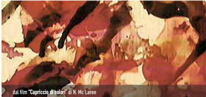
dal film "Capriccio di colori" di N. Mc Laren

Età consigliata: 8/12 anni | Durata: 2h | Costo: 9 €