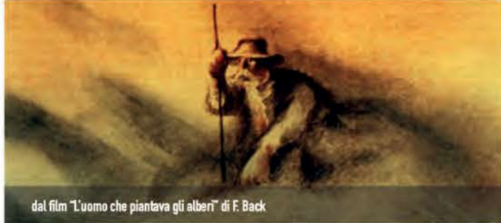
dal film "L'uomo che piantava gli alberi" di F. Back

Età consigliata: 8/10 anni | Durata: 2 h30 | Costo: 9 €