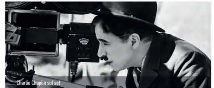
Charlie Chaplin sul set

Età consigliata: 8/14 anni | Durata: 2 h | Costo: 6 €